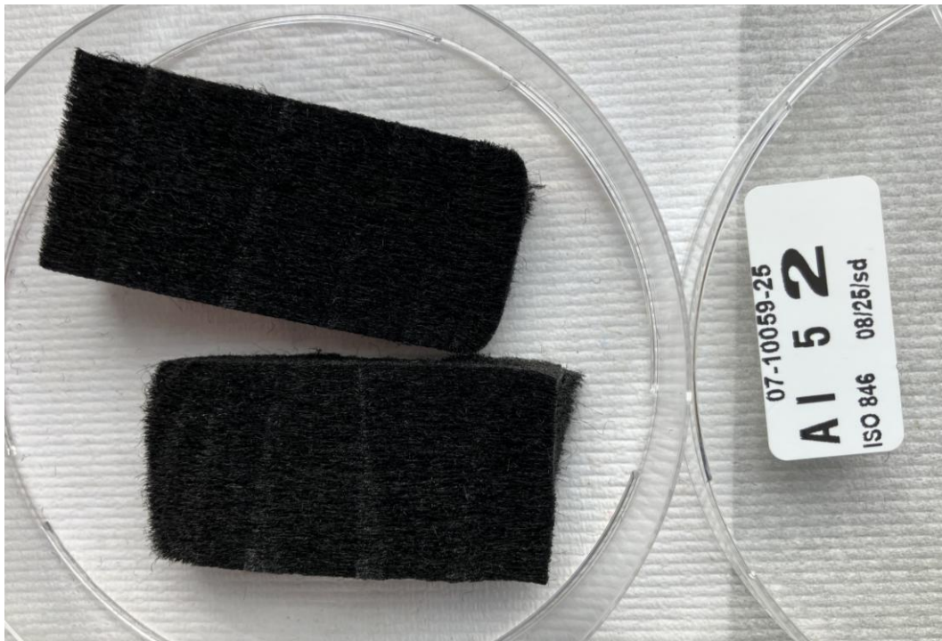
Abbildung 2: Prüfkörper des inokulierten Materials aPerf® board, schwarz (07-10059-25-2) (Gruppe I, beimpft) am Ende der Prüfung nach Verfahren A, DIN EN ISO 846:2020. Repräsentative Abbildung, Bewertung: 0.